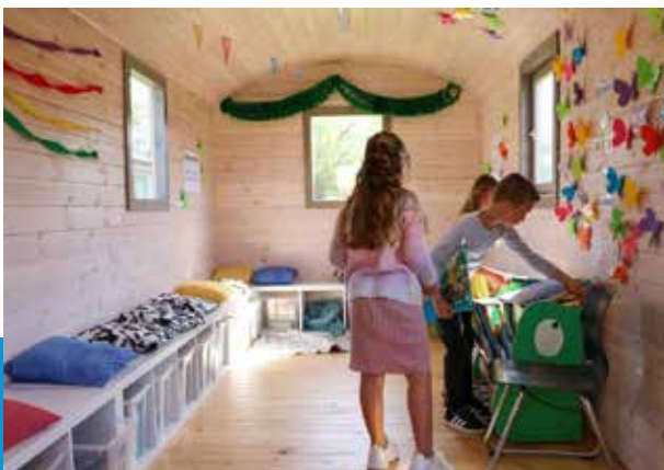
Basisschool De Brug