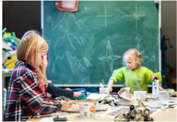
IKO De Kunstacademie