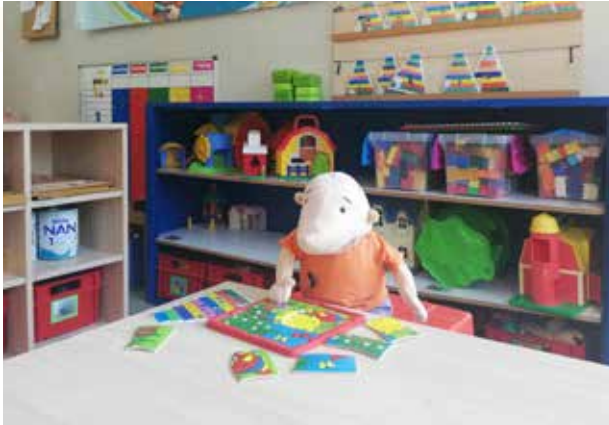
Daltonschool In 't Groen