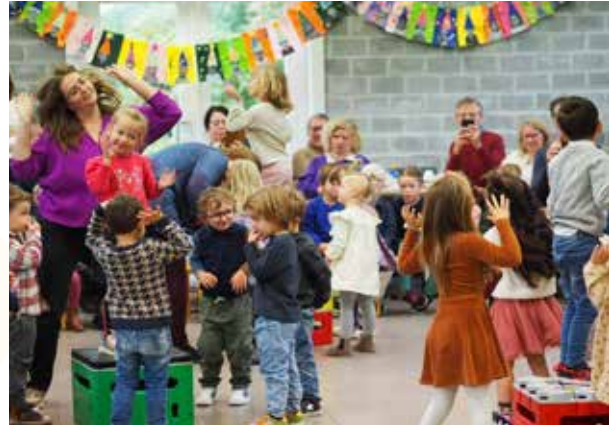
Vrije basisschool Maria Middelaars